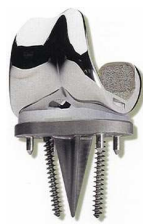
Prothèse de genou