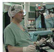
Robot de chirurgie assistée par ordinateur